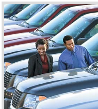
Märkte: Wachstumspotenziale systematisch erschließen