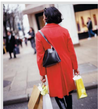
Konsumenten: Weltmarktführer in der Konsumentensegmentierung

Unsere Analysten modellieren die zukünftige Situation von regionalen, nationalen und globalen Wirtschaftsräumen und untersuchen dabei Merkmale wie z.B. Beschäftigung, Wirtschaftsleistung, Konsumausgaben oder Immobilien- und Kapitalanlagemarkt. Experian berät Unternehmen bei der Vorbereitung von Standortentscheidungen. International helfen wir Ländern und Gemeinden rund um spezifische Themen der Wirtschaftsförderung und Sozialpolitik.